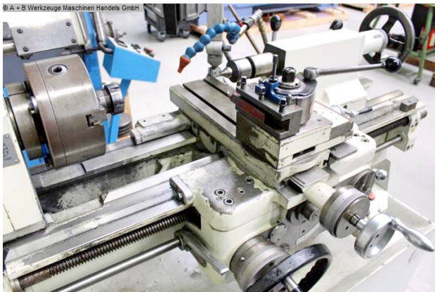
© A - B Werkzeuge Maschinen Handels GmbH