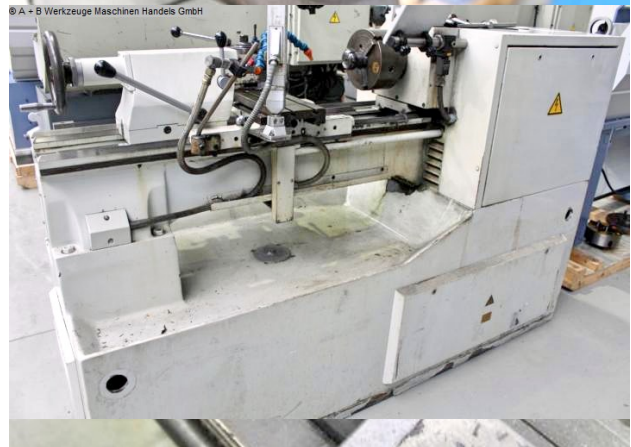
© A - B Werkzeuge Maschinen Handels GmbH