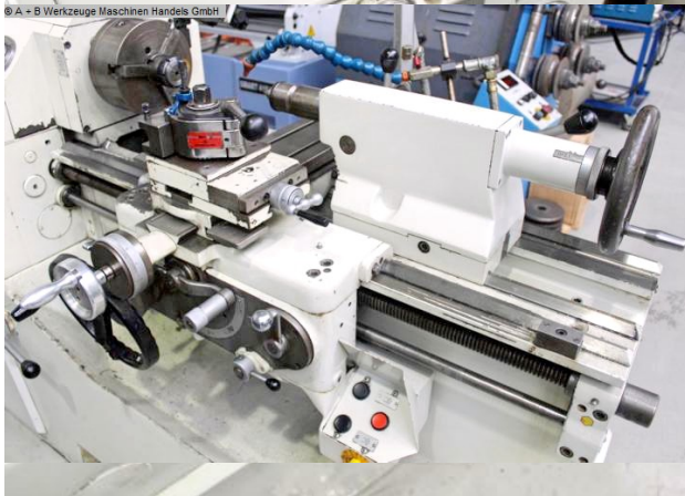
© A - B Werkzeuge Maschinen Handels GmbH