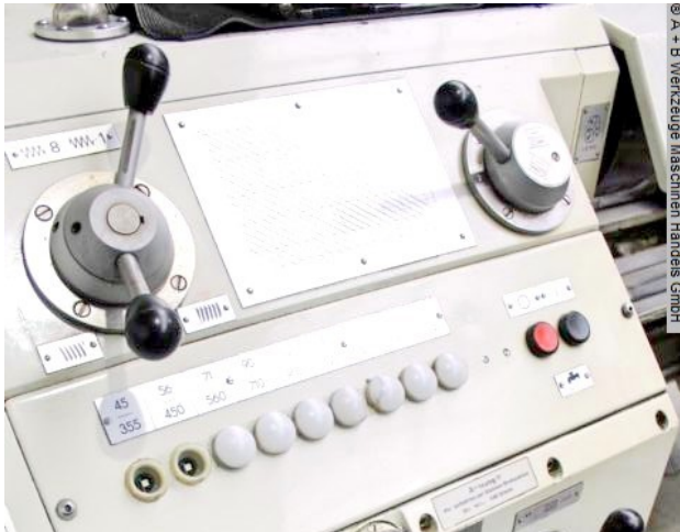
© A - B Werkzeuge Maschinen Handels GmbH

Schweißtechnik Lagereinrichtungen Industriebedarf Werkvertretungen Gebrauchsmaschinen