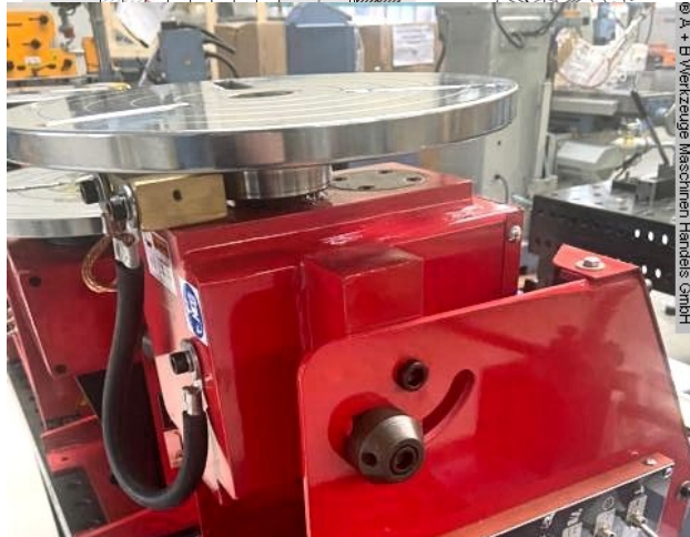
© A + B Werkzeuge Maschinen Handels GmbH