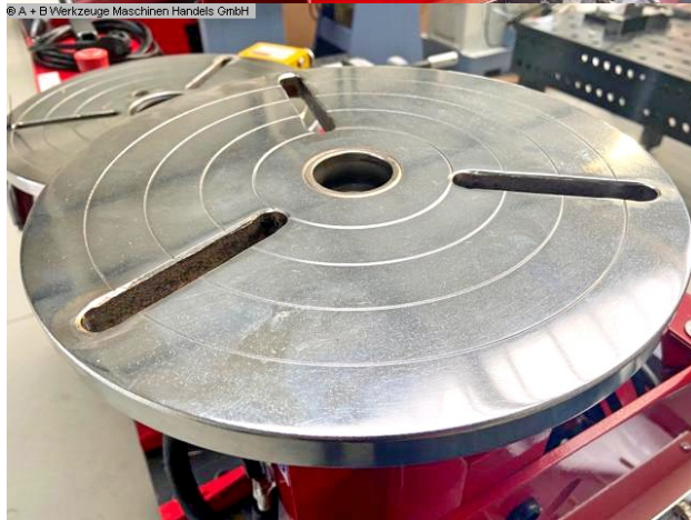
© A + B Werkzeuge Maschinen Handels GmbH