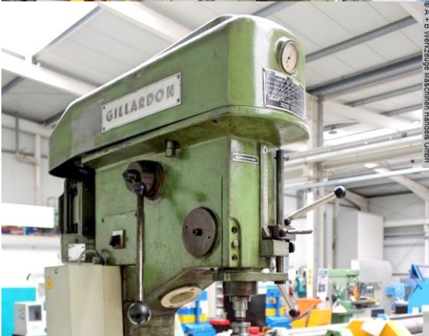
© A + B Werkzeuge Maschinen Handels GmbH