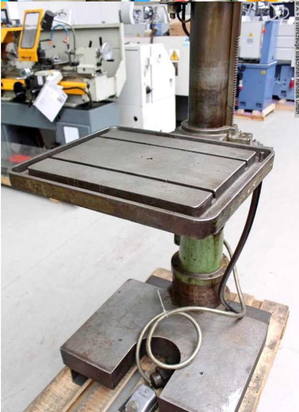
© A + B Werkzeuge Maschinen Handels GmbH