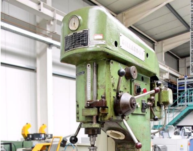
© A + B Werkzeuge Maschinen Handels GmbH

Schweißtechnik Lagereinrichtungen Industriebedarf Werkvertretungen Gebrauchsmaschinen