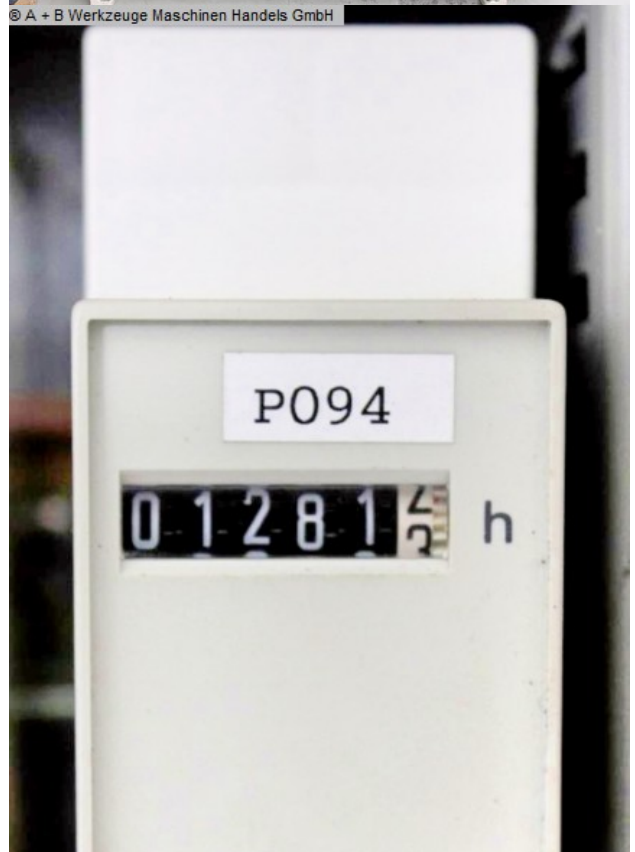
© A + B Werkzeuge Maschinen Handels GmbH