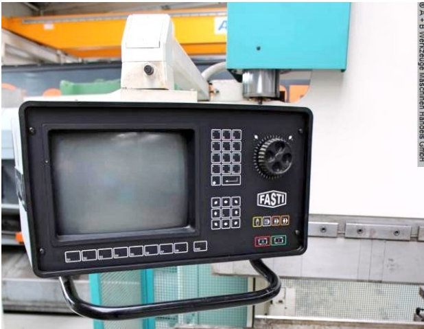
© A + B Werkzeuge Maschinen Handels GmbH

Schweißtechnik Lagereinrichtungen Industriebedarf Werkvertretungen Gebrauchtmachines