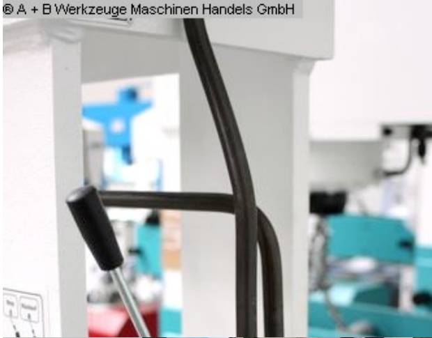
© A - B Werkzeuge Maschinen Handels GmbH