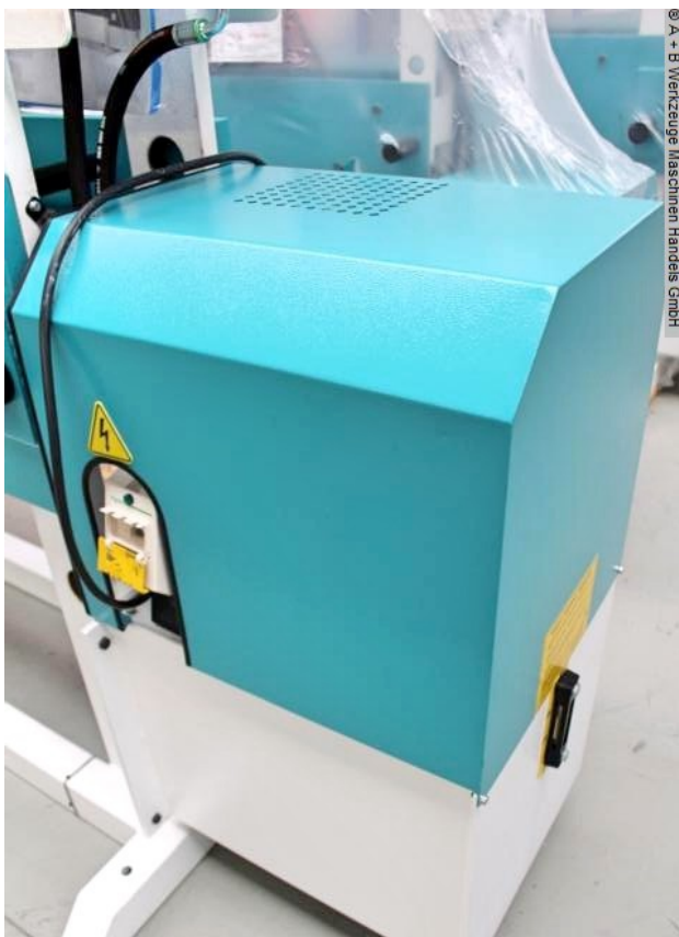
© A - B Werkzeuge Maschinen Handels GmbH