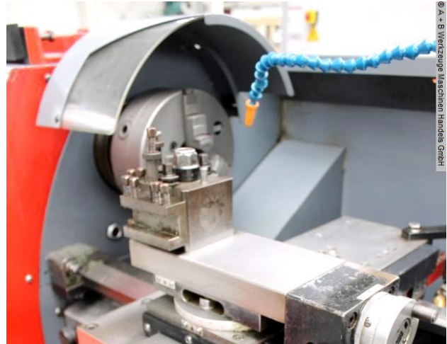
© A + B Werkzeuge Maschinen Handel GmbH