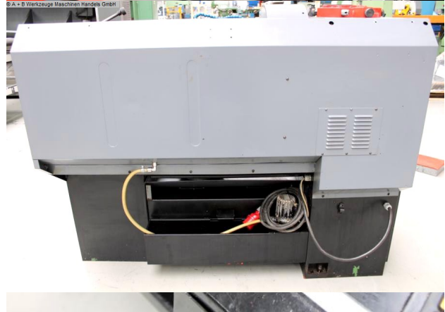
© A + B Werkzeuge Maschinen Handel GmbH