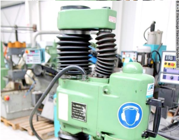
© A + B Werkzeuge Maschinen Handel GmbH