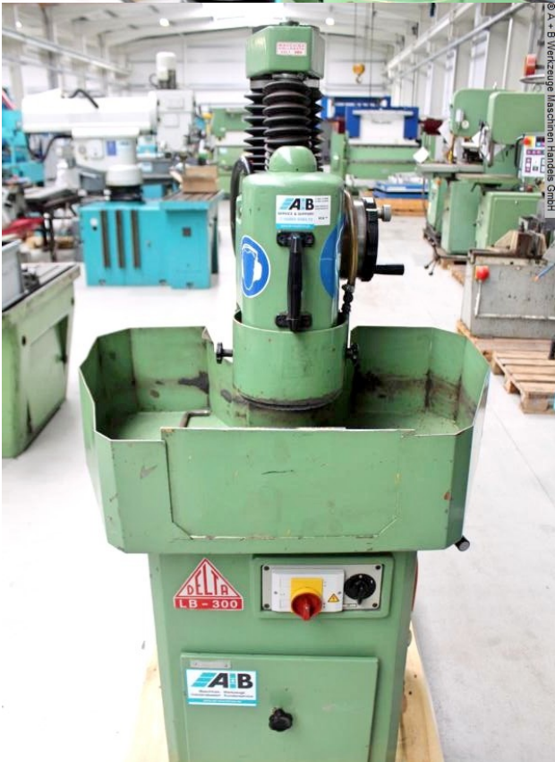
© A + B Werkzeuge Maschinen Handel GmbH