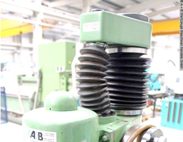
© A + B Werkzeuge Maschinen Handel GmbH

Schweißtechnik Lagereinrichtungen Industriebedarf Werkvertretungen Gebrauchsmaschinen