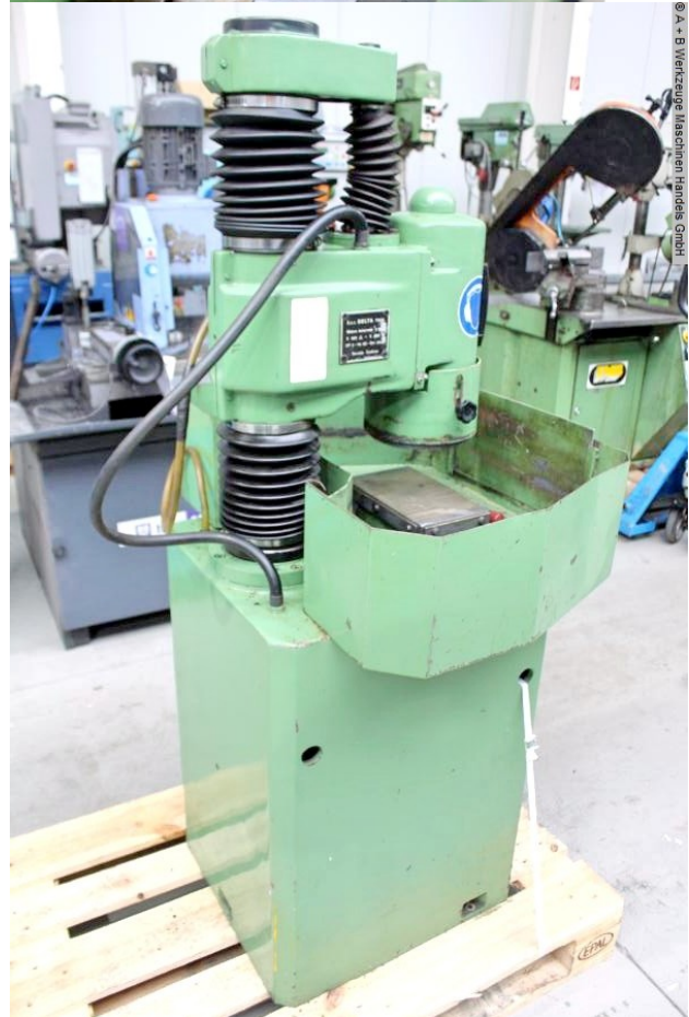
© A + B Werkzeuge Maschinen Handel GmbH