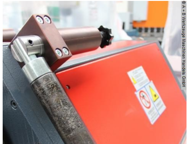
© A - B Werkzeuge Maschinen Handels GmbH