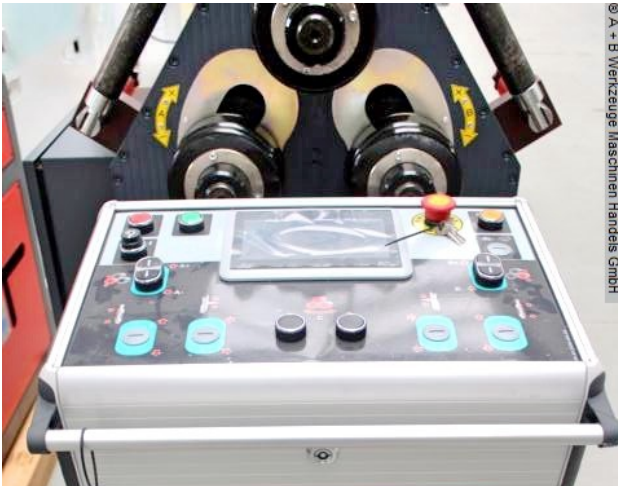
© A - B Werkzeuge Maschinen Handels GmbH

Schweißtechnik Lagereinrichtungen Industriebedarf Werkvertretungen Gebrauchtmaschinen