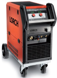
50 l - Flaschenwagen