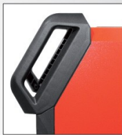
Schutz im Detail

Große Griffe erleichtern das Bewegen der Anlage und schützen zugleich Schalter und Anschlüsse.