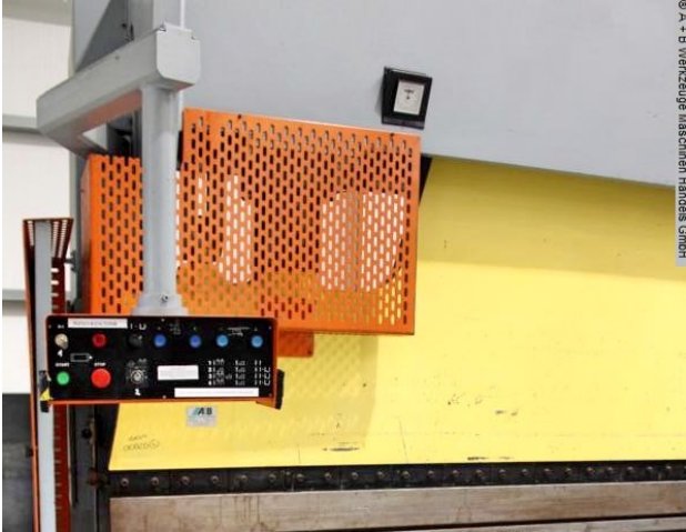
© A + B Werkzeuge Maschinen Handels GmbH

Schweißtechnik Lagereinrichtungen Industriebedarf Werkvertretungen Gebrauchtmaschinen