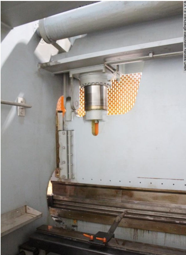
© A + B Werkzeuge Maschinen Handels GmbH